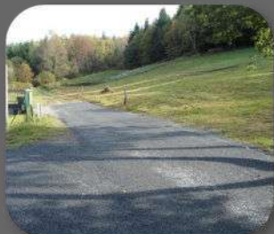
Goudronnage VC 7, 8 et 9