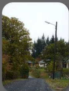
Eclairage public de la VC 7