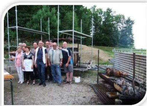
Repas champêtre - 5 Juillet 2014